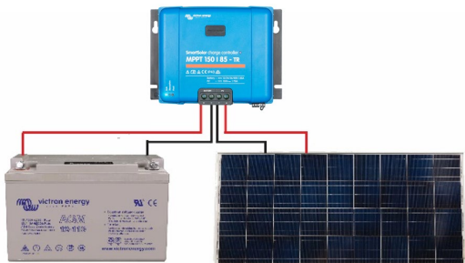
Figure 1: Power connections Illustration 1 : Connexions électriques Abbildung 1: Stromanschlüsse Figura 1: Conexiones de alimentación Bild 1: Strömanslutningar