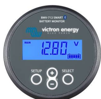
Bluetooth-detectie: BMV-712 Smart Battery Monitor