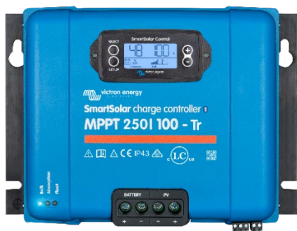
SmartSolar laadcontroller MPPT 250/100-Tr met optioneel koppelbaar display