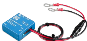
Bluetooth-detectie: Smart Battery Sense