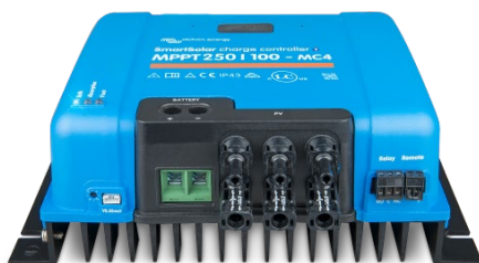
SmartSolar laadcontroller MPPT 250/100-MC4 zonder display