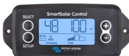
SmartSolar inplugbaar display